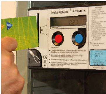
Compteur à budget électricité

Si votre ancien logement n'était pas équipé d'un compteur à budget, vous devez informer le plus rapidement possible votre fournisseur et votre gestionnaire de réseau qu'un compteur à budget est installé dans votre nouveau logement. Votre gestionnaire de réseau désactivera le compteur à budget afin que le compteur fonctionne à nouveau comme un compteur ordinaire.