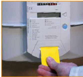
Compteur à budget gaz